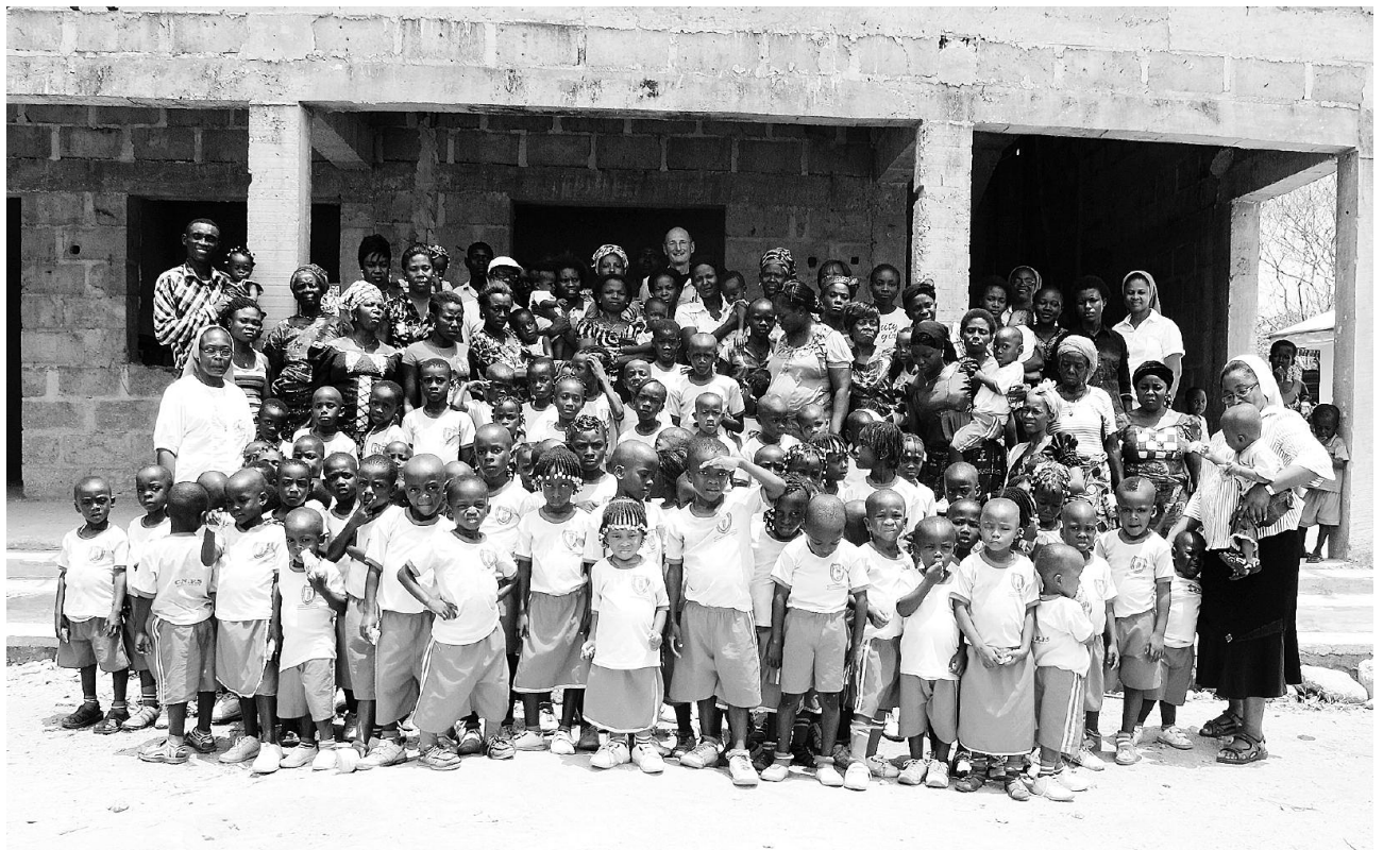
Bildung braucht auch Infrastruktur: Kinder, Eltern und Lehrpersonen freuen sich am neuen Schulhaus.

Viele Kinder haben einen Schulweg von fünf Kilometern. Auf den schlechten und gefährlichen Strassen kommen sie mit Okadas zur Schule (siehe Foto rechts). Dies ist mit finanziellem Aufwand verbunden, den manche Eltern nicht aufbringen können. Deshalb möchte man einen Schulbus kaufen, mit dem die Kinder sicher und schnell zur Schule gebracht werden