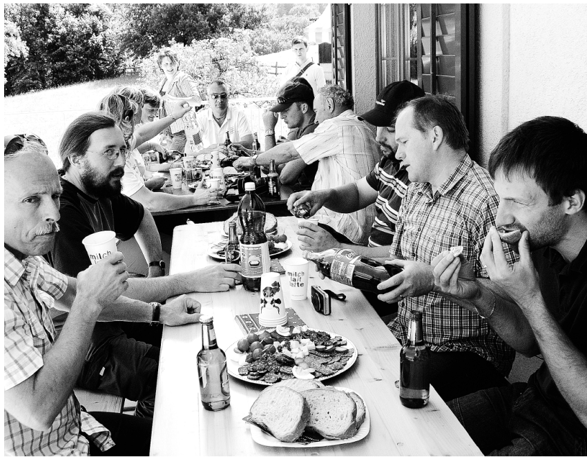
Direkt vom Hof: Das Wasserbüffel-Fleisch und der -Käse schmeckten hervorragend, wie die Besucher feststellten.

Hobi stellte das LZSG als Kompetenzzentrum für die Landwirtschaft, die Ernährung und den ländlichen Raum im Kanton St. Gallen mit seinen multifunktionalen Aufgaben vor.